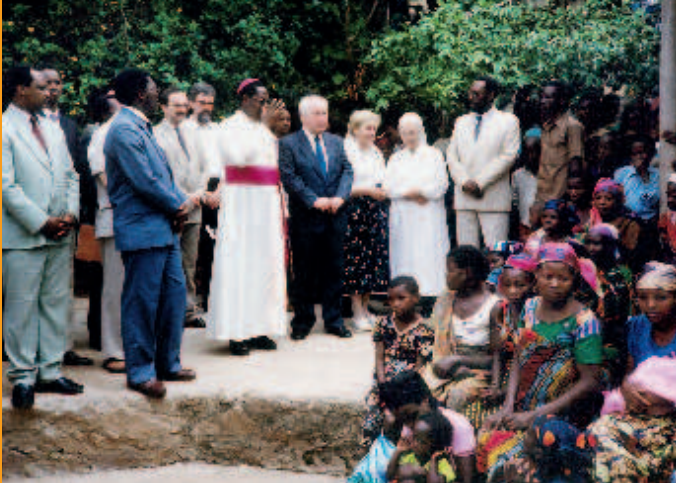
Die Zusammenarbeit mit Partnern vor Ort – vor allem mit den Kirchen – gewährleistet, dass die Hilfe bei den Menschen ankommt.