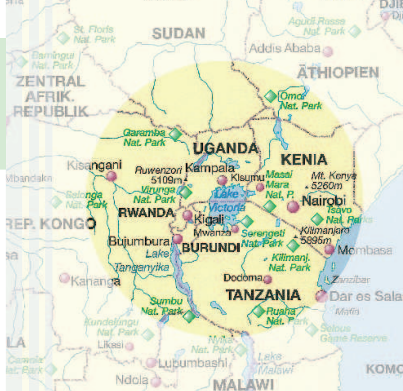
Burundi mit seiner Hauptstadt Bujumbura liegt im Herzen Afrikas am großen Tanganjikasee.

Lebensstandard und wirtschaftliche Entwicklung sind auf einem kaum beschreibbaren Tiefstand. Das CJD möchte mit seinen hohen Kompetenzen im Ausbildungsbereich in diesem Land, das zu den ärmsten der Welt zählt, für die burundische Jugend Chancengeber sein.