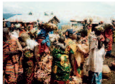
Viele Familien sorgen sich um die Zukunft ihrer Kinder.

Die bedarfsgerechte Ausbildung junger Menschen in verschiedenen Berufsfeldern kann auch in Burundi, diesem kleinen überschaubaren demokratischen Staat im Herzen Afrikas am Tanganjikasee mit rund sieben Millionen Einwohnern und der Hauptstadt Bujumbura, zum Schlüssel für eine erfolgreiche Entwicklung werden. Das Land gehörte übrigens einmal zum Gebiet Deutsch-Ostafrika.